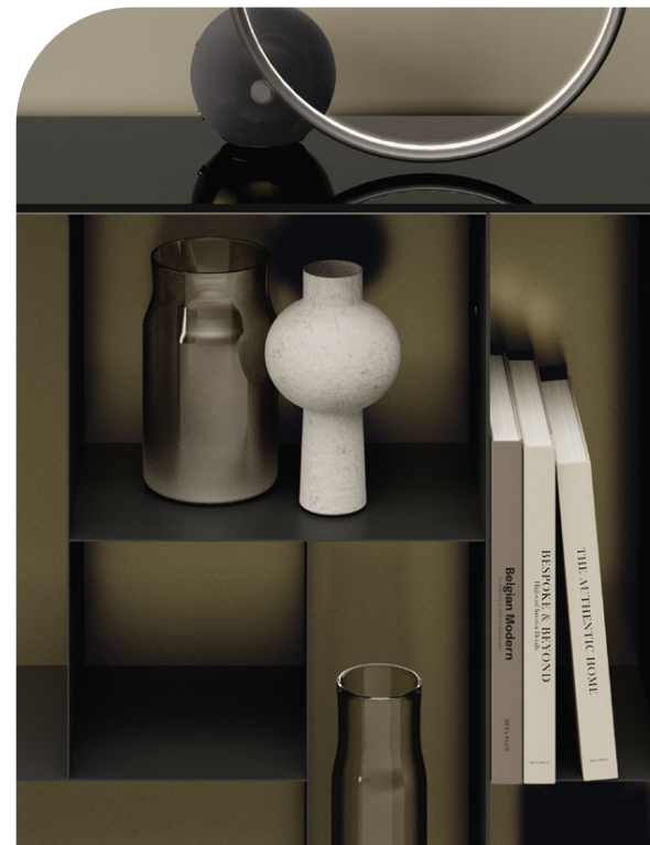
[In questa immagine] Atena libreria 3 moduli cod. 16.32 struttura M055, schiena M328, Atena zoccolo libreria 3 moduli cod. 16.36 M055 | Circle da tavolo cod. 56.52 base M310, struttura M328 • [In this picture] Atena bookcase 3 modules cod. 16.32 frame M055, back M328, Atena bookcase base for 3 modules cod. 16.36 M055 | Circle table lamp cod. 56.52 base M310, frame M328